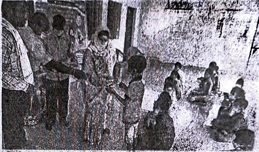
वणी रंभापूर येथे आयोजित सेवा सप्ताह कार्यक्रमात उपस्थित मान्यवर.

आत्मनिर्भर ग्राम अभियान प्रेरित महा एनजीओ फेडरेशन पुणे व सेवाधर्म शिक्षण व बहुउद्देशिय संस्था अकोला द्वारा पंडित दिनदयाल उपाध्याय, राष्ट्रपिता महात्मा गांधी व पंतप्रधान नरेंद्र मोदी यांच्या जन्मदिनाचे निमित्त साधत तसेच श्री श्री श्री रविशंकर यांच्या प्रेरणेने वणी रंभापूर येथे सेवा सप्ताह कार्यक्रम घेण्यात आला. यानिमित्त गरजूंना मदत करण्यात आली.